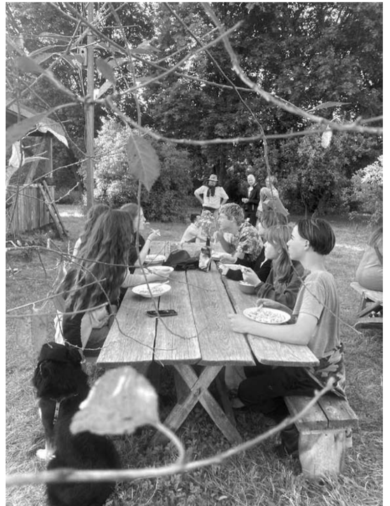
Bendrystė prie pietų stalo.

„Ši ekskursija po girią pasibaigė atkeliavus iki skardžio. Toliau nebebuvo kur eiti ir tai buvo kvietimas sugrįžti ten, iš kur atėjome, susimąstyti, kad esame gamtos dalis ir nuo jos