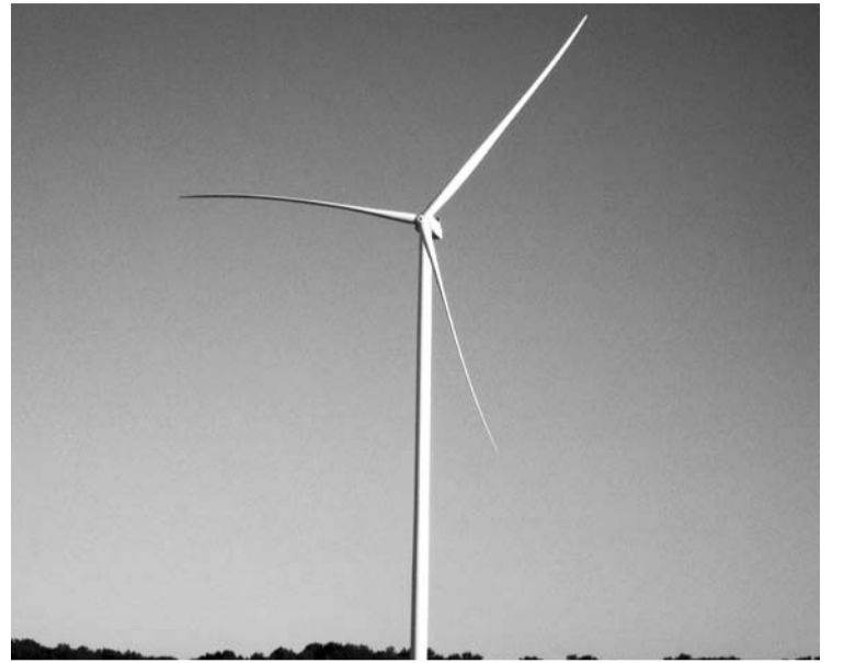
Nesisukant Staškūniškio vėjo elektrinių sparnams, jų savininkai kiekvieną mėnesį praranda bent milijoną eurų.

AB ESO atstovas „Anykštai“ nurodė, jog net elektros pirkimo sutarties su UAB „European Energy Lithuania“ turėjimo ar neturėjimo faktas yra konfidenciali informacija, todėl tai, kokiomis kainomis verslininkai galėtų tiekti elektrą į bendrą sistemą, nėra aišku. Žinia, elektros