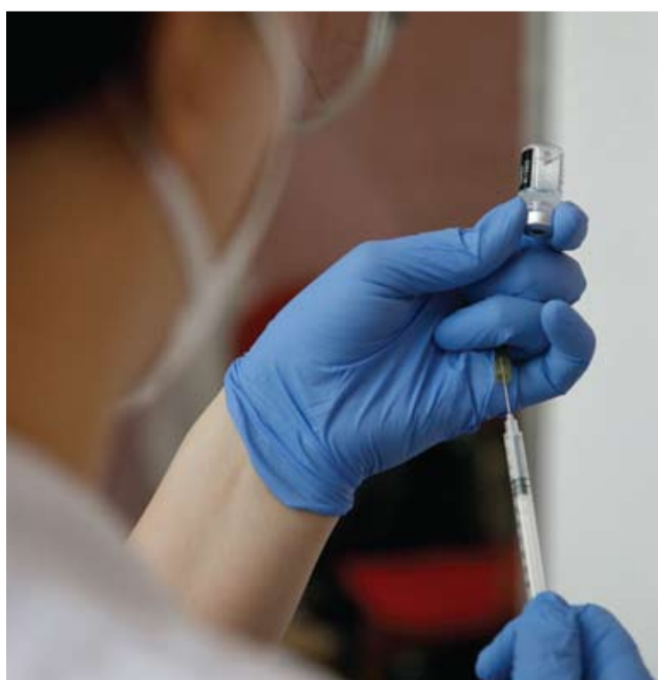
Teigiama, kad visi „Comirnaty“ flakonai, kurių vartojimo galiojimas baigiasi 2022 metų birželio mėnesį, ir vėliau bus tinkami vartoti dar devynis mėnesius.