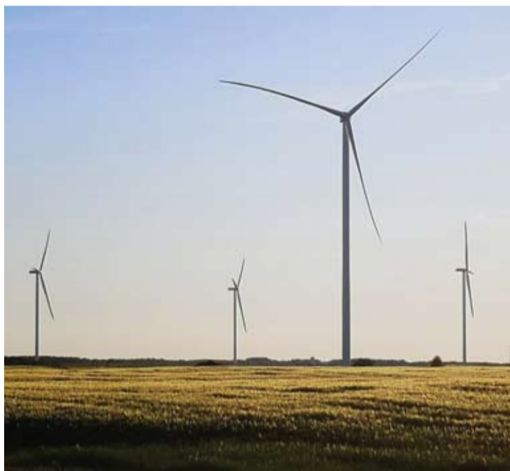
Elektrinių parkai vadinami ir vėjo jėgainių fermomis. Staškūniškio ferma tebesnaudžia...