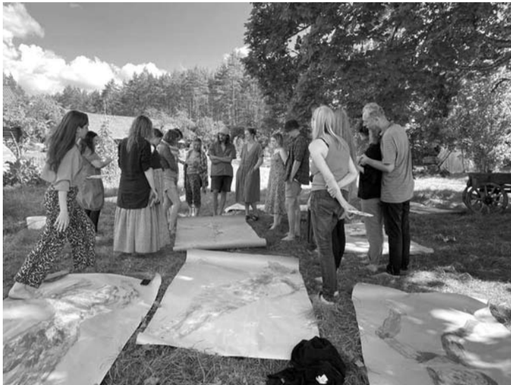
Kūrybinės dailės dirbtuvės.

Rugpjūčio 6 - 12 dienomis Šimonių girios supamoje XIX amžiaus sodyboje Inkūnuose jau 5-ąjį kartą vyko Anykščių miesto Jurzdiko bendruomenės organizuojamas Miško festivalis.