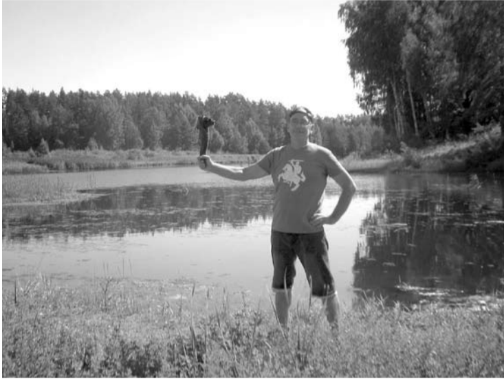
Prie Augustino prūdo surasta „istorinė kuoka“.

Nors dėl tyrančio karščio ir daugybės kitų priežasčių į istorinio pažinimo kelią nuo didžiojo kryžiaus išriedėjome vos trise, tačiau įspūdžių ir smagumo nepritrūkom.